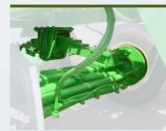
AXE ARRIERE AUTO-DIRECTIONNEL