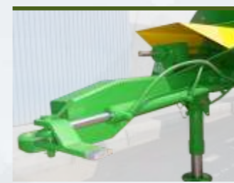
APPUI AVANT ET LANCE DE CONTROLE D'AXE DIRECTIONNEL HYDRAULIQUES