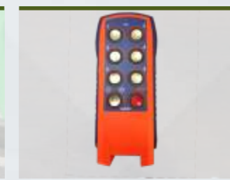
CONTROLE A DISTANCE