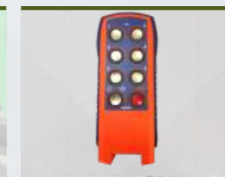
COMANDO À DISTÂNCIA