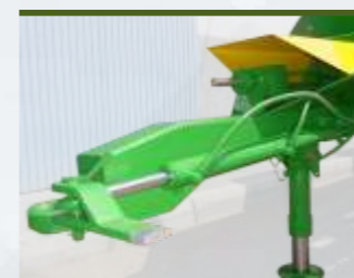
APOIO DIANTEIRO E LANÇA DE COMANDO DO EIXO DIRECCIONAL HIDRÁULICOS