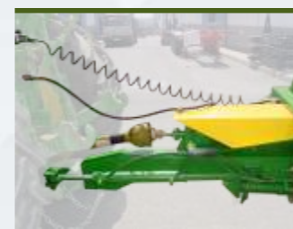
EQUIPAMENTO HIDRÁULICO INDEPENDENTE ACIONADO POR TRANSMISSÃO