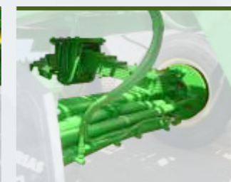
EIXO TRASEIRO AUTO-DIRECCIONAL